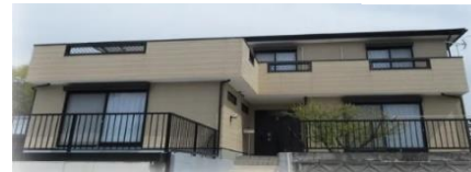
建物外観。スタッフが夜でも常駐しているので安心です。