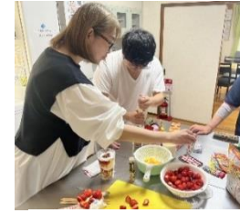
みんなでパフェ作り