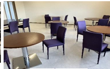
食堂 兼 休憩室