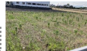
広い土地は農地になる予定