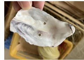
牡蠣の貝殻。中央に穴が開いています。