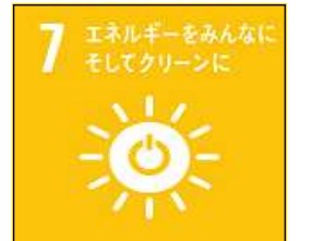
【気候変動アクション環境大臣表彰】 【SDGsの重点】