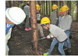
【4年：九電の森自然体験】