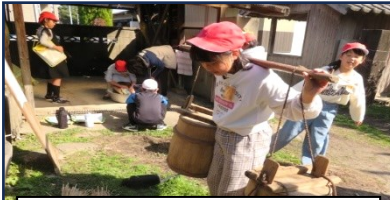
2/27 昔の道具 3年生

3年生は社会科と総合的な学習で昔の暮らしについて学習しており、その一環として白光中校区のお宅にお邪魔しました。様々な昔の生活道具に実際に触れることで、昔の暮らしについて、学習を深めることができました。