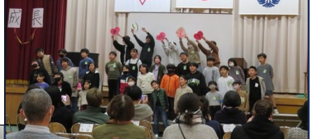
3/1 成長発表会 4年生

4年生はこれまでの10年間の成長とおうちの方への感謝を伝える会を開きました。自分達で内容や進行を考え、10才の誓い、親子でのレクリエーション、呼びかけや歌を行い、自分達の成長を実感する機会となりました。