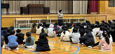
3/5 予告なし避難訓練

災害はいつ起きるかわかりません。予告なしの訓練で、みんなバラバラに行動している中休みに行いました。初めてにしては、素早く集合することができました。今後もしもという時に備えていきたいと思えます。