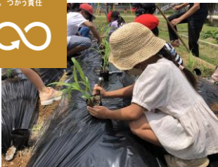
ともろこしを大切に育てて地域の人たちと交流