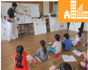
環境学習や福祉学習を通して住みつけられるまちづくりの学習