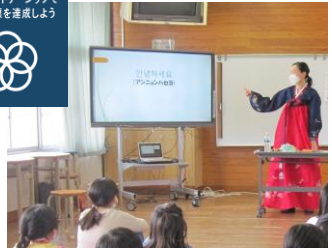
国際理解教育学習と中国大口市第十八小学校との交流