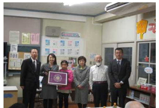
校歌・校章作成者そろって 記念撮影