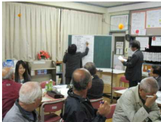
(校名案選考の様子)

投票は、最終案の6案から2～3案に絞るという確認のもと、委員による投票が行われ、得票数が多かった「駛馬」と「はやめ」の2案に絞り込みを行いました。投票結果は以下の通りです。