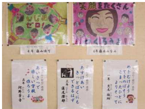
<ポスター・標語入選代表作品>

人は、一人では生きていくことはできません。互いに支え、支えられながら、社会の中で生きています。そして、「思いやり」というあたたかい心に包まれて生きていくのです。社会の中で出会うさまざまな人々との関わりの中で、互いに助け合い、支えられながら生きていくのです。