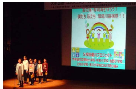
明治小学校の発表

「ふるさと三池をカルタで発信しよう！」 大牟田市で最も古い歴史をもつ三池小学校の4年生が、校区の歴史を地域の人々とともに調べ、そのすばらしさを多くの皆さんに知ってもらうために、カルタにして伝える活動に取り組んだことを発表しました。