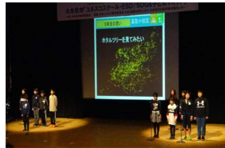
高取小学校の発表

「宝の海『有明海』を守ろう！『僕たち私たち 環境川探検隊！』」(明治小・吉野小・中友小・上内小・玉川小5校協働プロジェクト) 宝の海「有明海」を守るために、有明海に注ぐ5つの川の流域の小学校で協働プロジェクトに取り組み、川を調査し、自分達にできることについて考え、実践してきたことを発表しました。