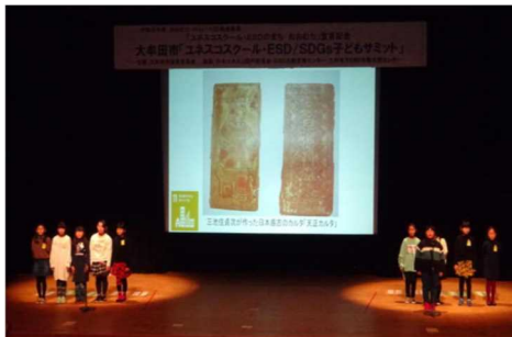
三池小学校の発表

令和2年1月11日(土)に大牟田文化会館で開催された「ユネスコスクール・ESD/SDGs 子どもサミット」の様子の続報です。三池小学校、明治小学校、高取小学校の3校の発表と、大正小学校から日本ユネスコ協会連盟への書き損じハガキの贈呈、白光中学校からの気仙沼市への義援金の贈呈の様子をお伝えします。