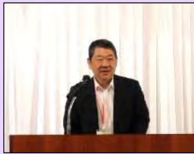
来賓挨拶 文部科学省文部科学戦略官 平下 文康 様