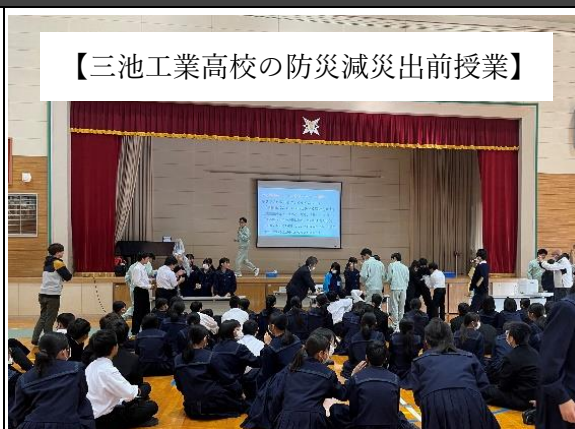
【三池工業高校の防災減災出前授業】