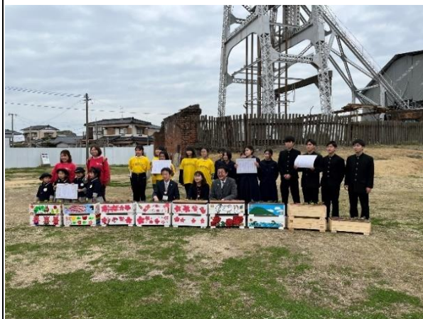
【「宮原坑」でのプランター贈呈式】

これらの活動について、10月のストックホルム日本人学校補習校との交流や、12月のアシストプロジェクト助成校交流会で、発表をし、国内外に広く発信した。