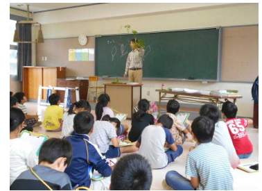
GTから木の話を書く