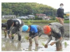
＜米づくり・田植え＞