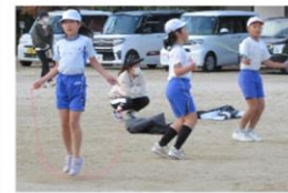
＜縄跳び検定・長縄＞