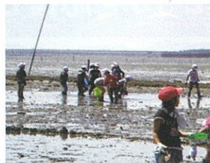
有明海の干潟観察