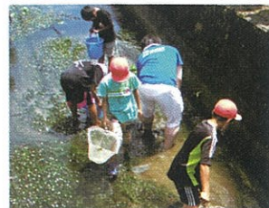
海へつながる川の観察