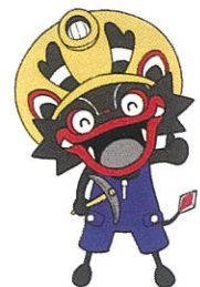
大牟田市公式キャラクター「ジャー坊」