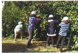
玉川小よりみかん

玉川小学校は、地域の方々とつながり、地域の特産物の栽培や収穫を体験する『食』の大切さを学習しています。北海道留寿都小学校との農業交流をとおして、地域の特性のちがいやふるさとのよさを学習しています。