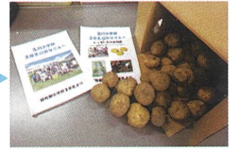
留寿都小よりジャガイモ