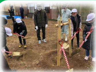
吉野小桜プロジェクト