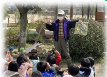
生き生きビオトープ大作戦